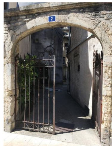
2 place Carnot