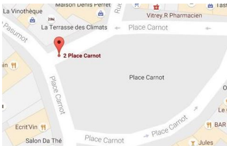
Cliquer sur le plan pour accéder à Google Maps

Pour faciliter votre trajet, il vous est possible de localiser "la Terrasse des Climats" sur les applications Google Maps et Apple Plans .